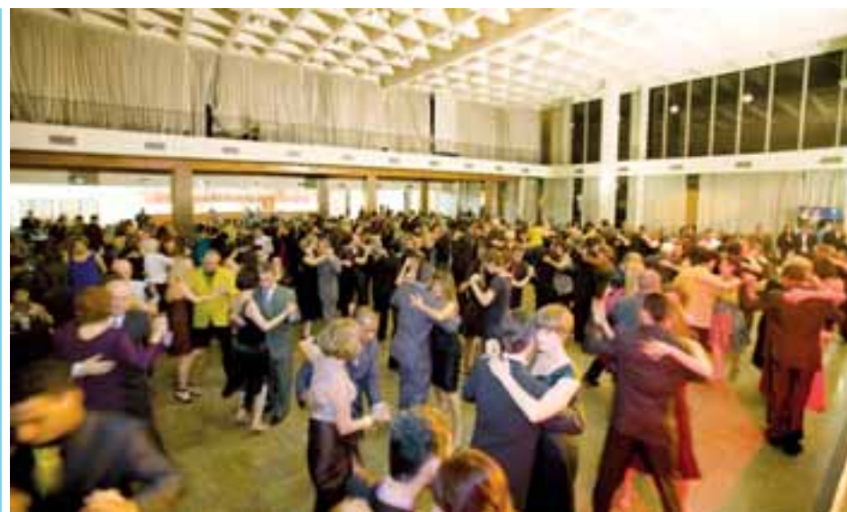
A festa reuniu... ...cerca de 800 pessoas no Club Homs