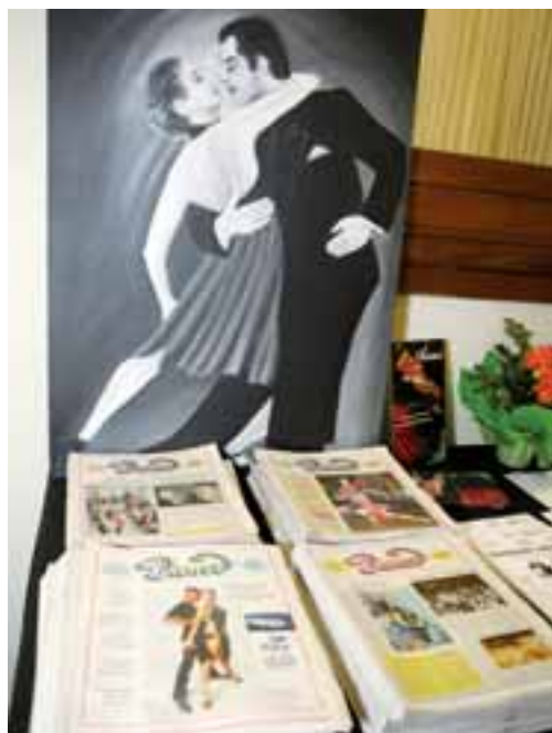
As mais recentes edições, com um dos quadros do pintor Roberto Vivas