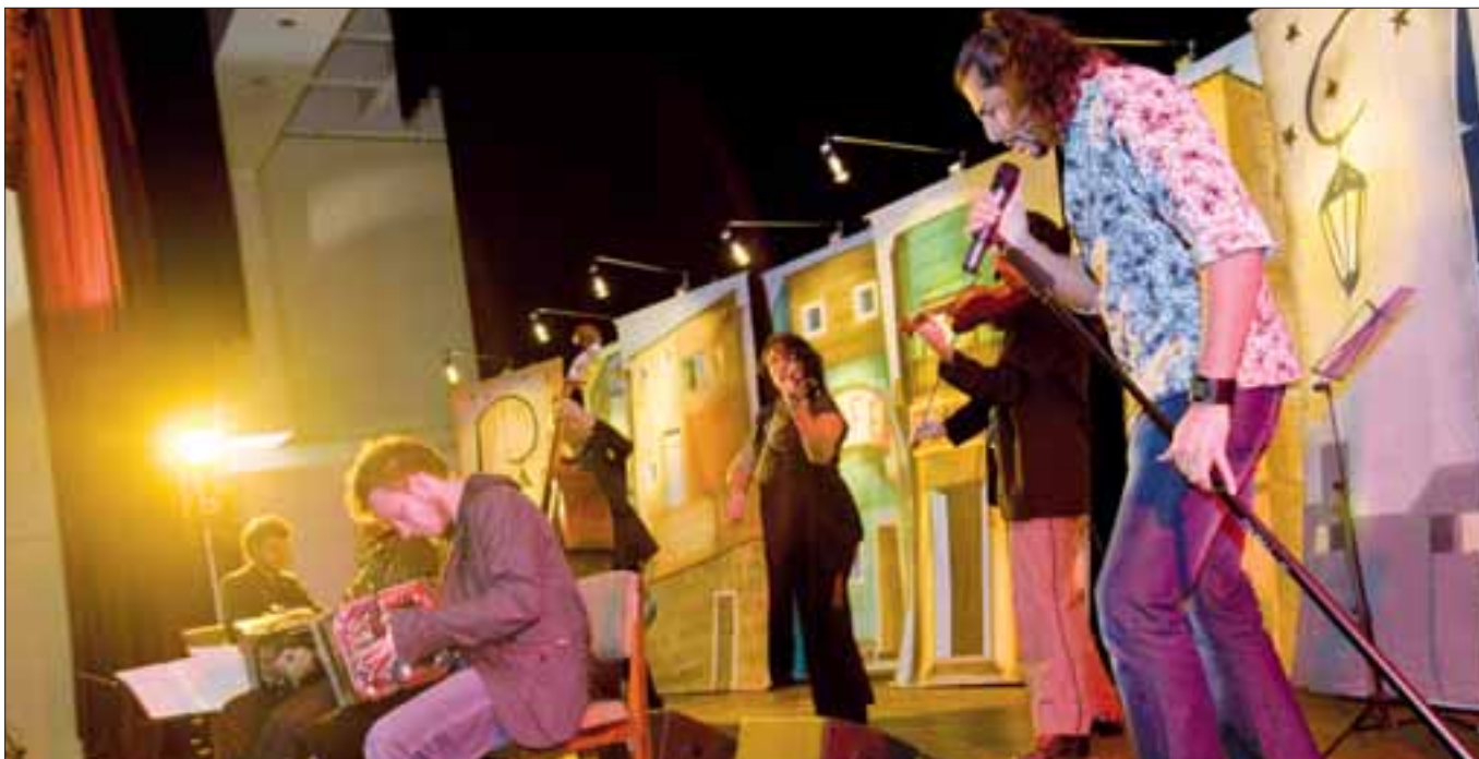
Sexteto Milonguero, de Buenos Aires, empolgou e foi intensamente aplaudido pelos dançarinos