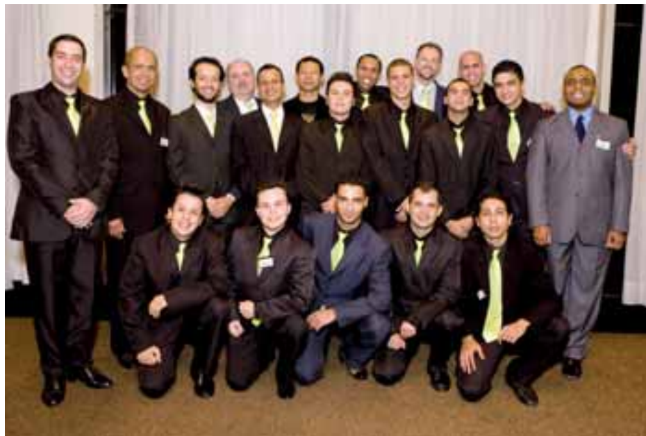
Foram duas equipes personal dancers, da Costa Cruzeiros e da Confraria do Tango