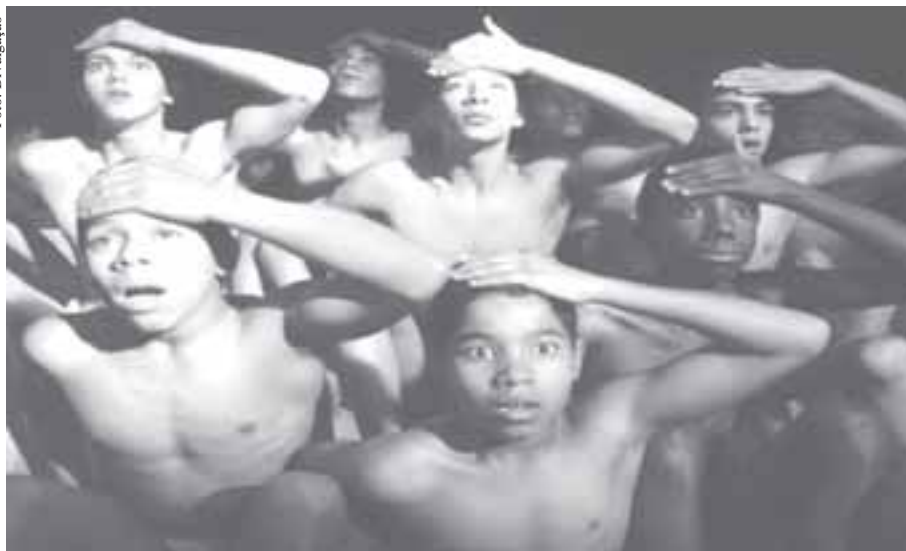
Os jovens bailarinos em performance para o espetáculo Minha Alma, da Abamba