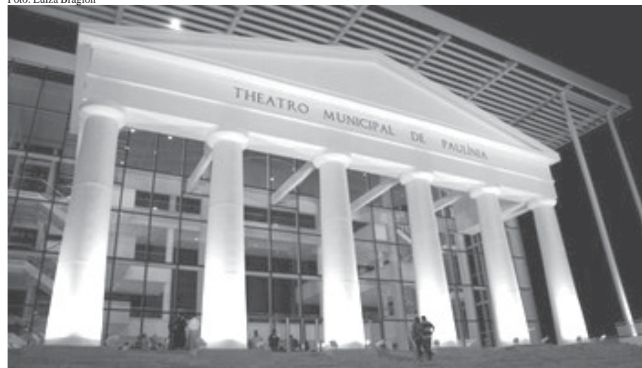
Fachada do Theatro Municipal de Paulínia: obra faraônica deve beneficiar os artistas da região