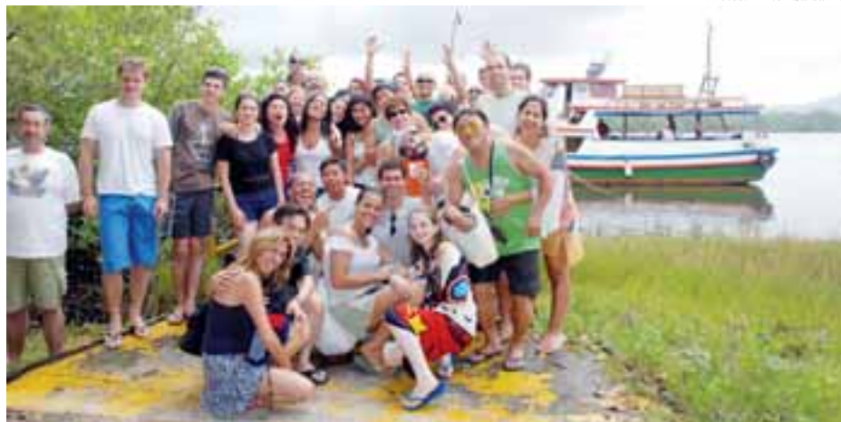
O grupo forrozeiro na Ilha do Cardoso