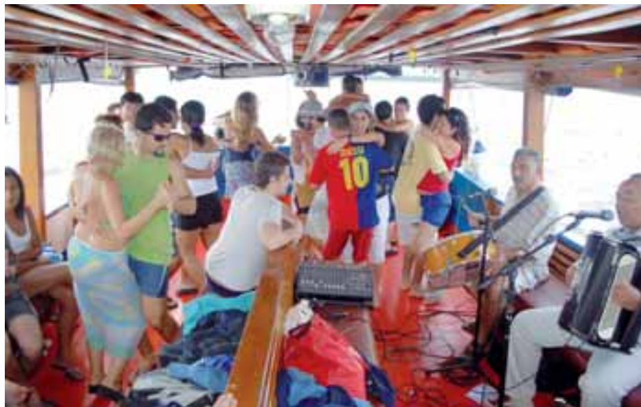
Baile na escuna, o tempo todo, na ida e na volta da Ilha do Cardoso