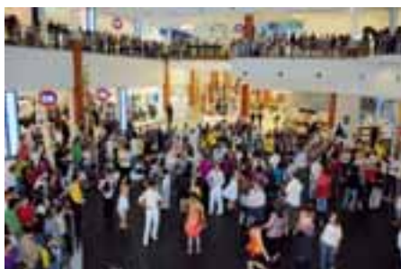
Numeroso público foi ao Floripa Shopping, em dois dias, acompanhar o campeonato de dança