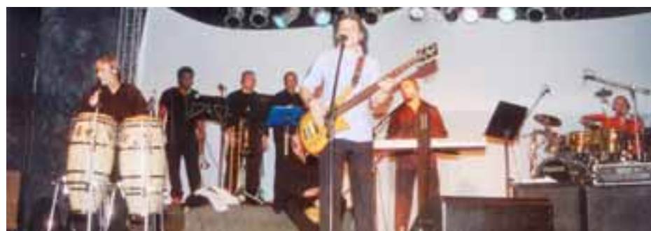
Banda Azucar levou um repertório especial para o Congresso de Salsa