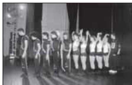
O grupo Phoenix, tricampeão no Salsa Open