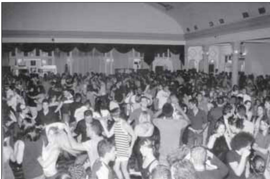
Sempre salões lotados, em todos os bailes