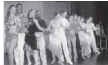
Grupo finalista do Salsa Open