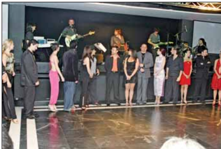
O grupo de dançarinos com a Narcotango ao fundo