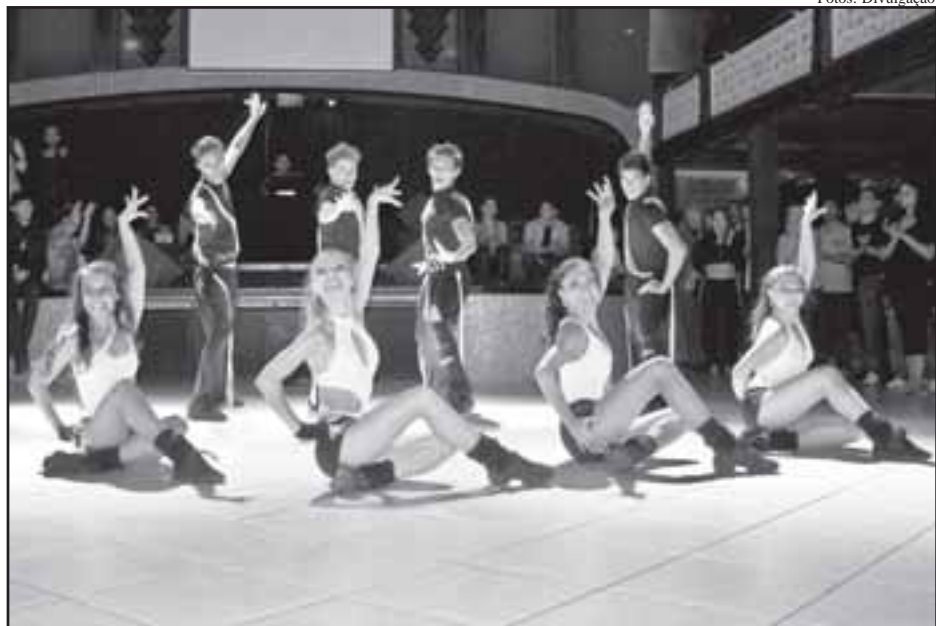
Apresentação da Cia Phoenix na Stones