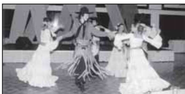
Show do grupo folclórico paraguaio Compases