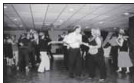
O Dança & Relax teve aulas, matins e jantares dançantes