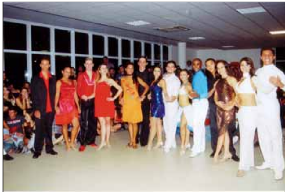
Foram sete casais no concurso