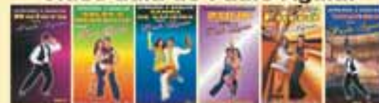
IMAGEM DE ALTA QUALIDADE (DIGITAL)