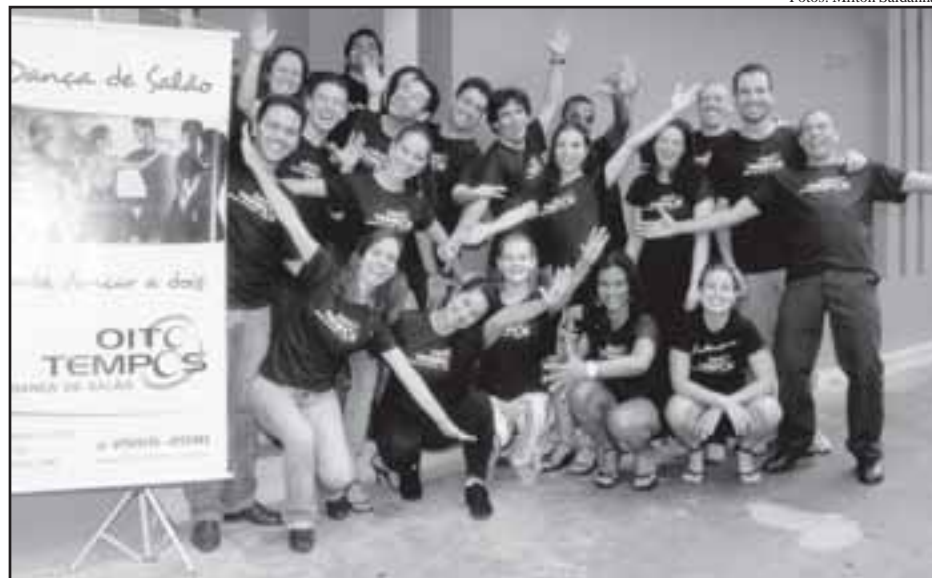
Equipes de Curitiba e Belo Horizonte confraternizam na nova unidade