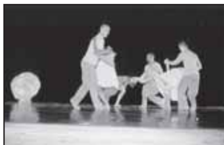
O espetáculo "Amar a Maria" é bonito e sempre emociona