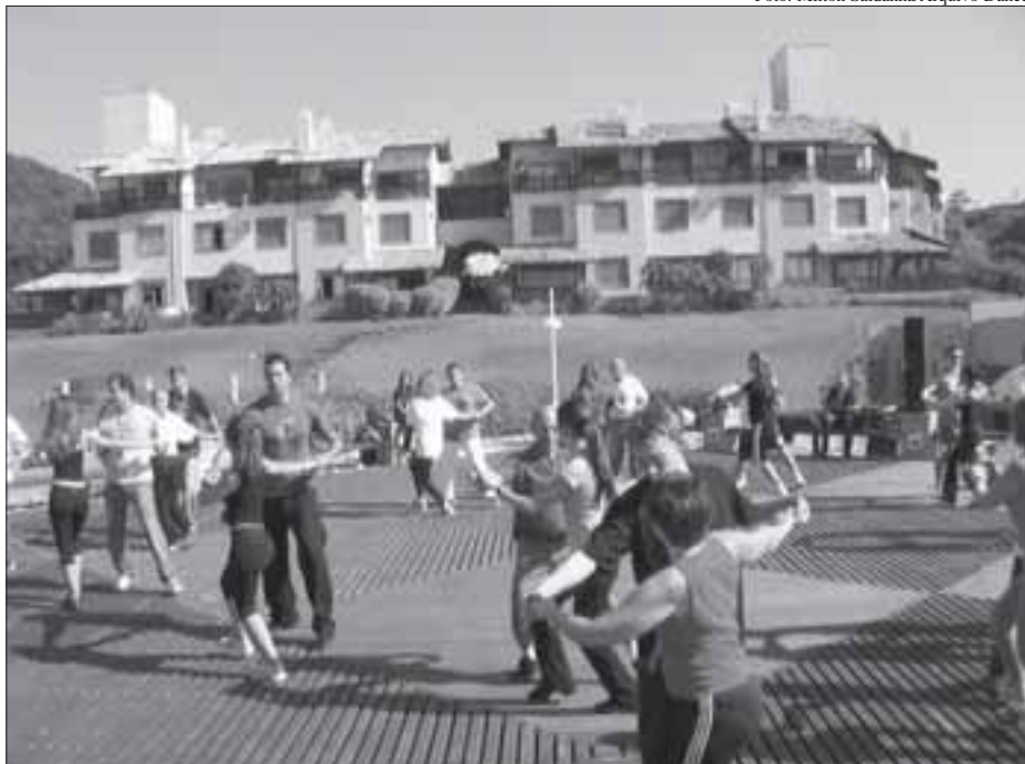
Uma das aulas ao ar livre na edição do ano passado