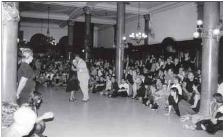
Além de aulas o dia todo, havia milongas e shows todas as noites, como este, dos "velhos milongueiros", na célebre Confeitaria La Ideal