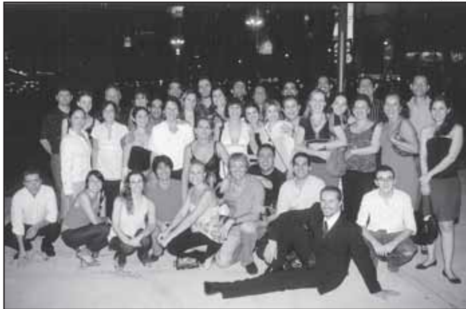
Parte do grupo brasileiro, em pose noturna no Obelisco

Organização: Cosmotango Direção: Fabiàn Salas 15 a 22 de março A nova estrutura prevê aulas para show, preparação de professores e tango de salão. Escritório: Florida, 835 – 2º - sl. 216 Tel. 4313-0802 ou 4313-0766 www.cosmotango.com