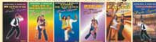
IMAGEM DE ALTA QUALIDADE (DIGITAL)