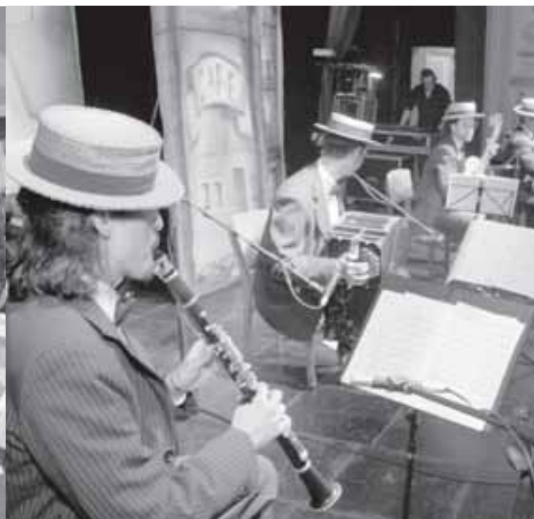
Banda La Tubatango foi muito aplaudida em todas as seleções