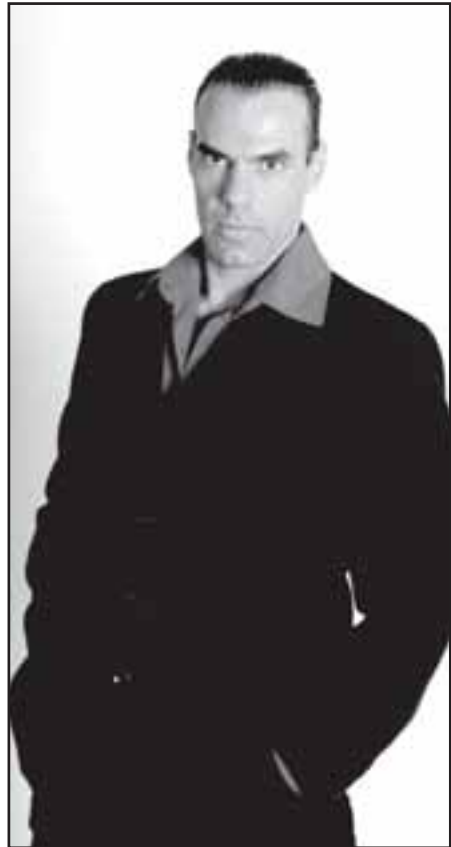
Junior tem vasto currículo, que cresce mais a cada dia

Um dos maiores tangueros do mundo na atualidade, com consagrada carreira internacional que inclui temporadas em vários continentes. Bailarino, coreógrafo e cineasta. Brasileiro radicado desde maio de 1992 em Buenos Aires, onde ocupa o topo das grandes estrelas do tango portenho.