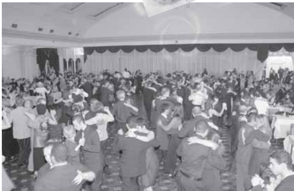
A limitação dos ingressos possibilitou um baile bom para dançar