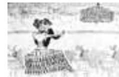
A decoração nas mesas e no palco evidenciou os cuidados nos mínimos detalhes para oferecer um baile bonito e com muito glamour