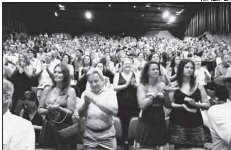
Quase mil pessoas aplaudem em pé no final do espetáculo