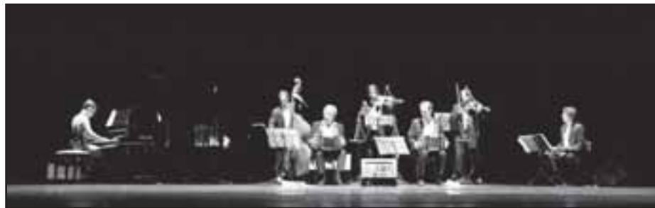
Orquestra Color Tango, super aplaudida no teatro