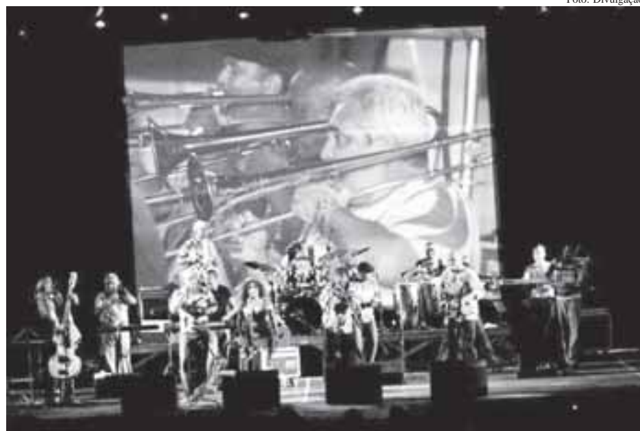
Banda cubana Los Van Van é uma das grandes atrações deste ano

to da Matakli Produtora, que a cada edição terá um país da América Latina como tema. O Festival está programado para acontecer em outubro de 2007, mês de aniversário da morte de Che Guevara, e o primeiro país prestigiado será Cuba.