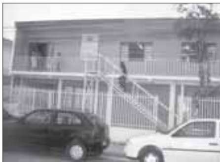
Prédio foi adaptado para ser escola