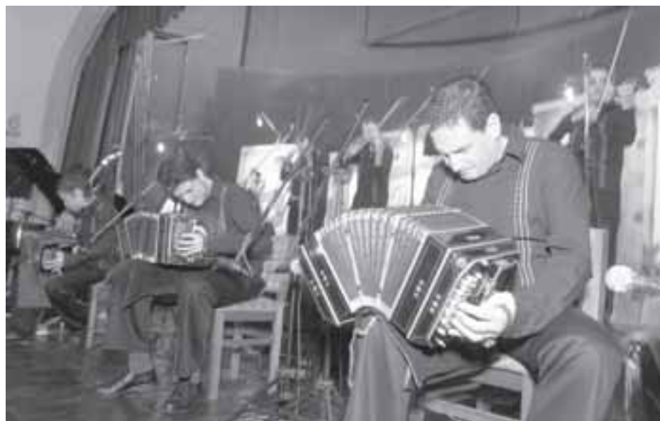
A Orquestra Típica Fervor de Buenos Aires é integrada por dez músicos

O próximo e último baile do ano da Confraria será dia 25 de novembro, também no Homs. O primeiro de 2007 acontecerá pela segunda vez no Dançando a Bordo, em fevereiro, no navio Costa Fortuna.