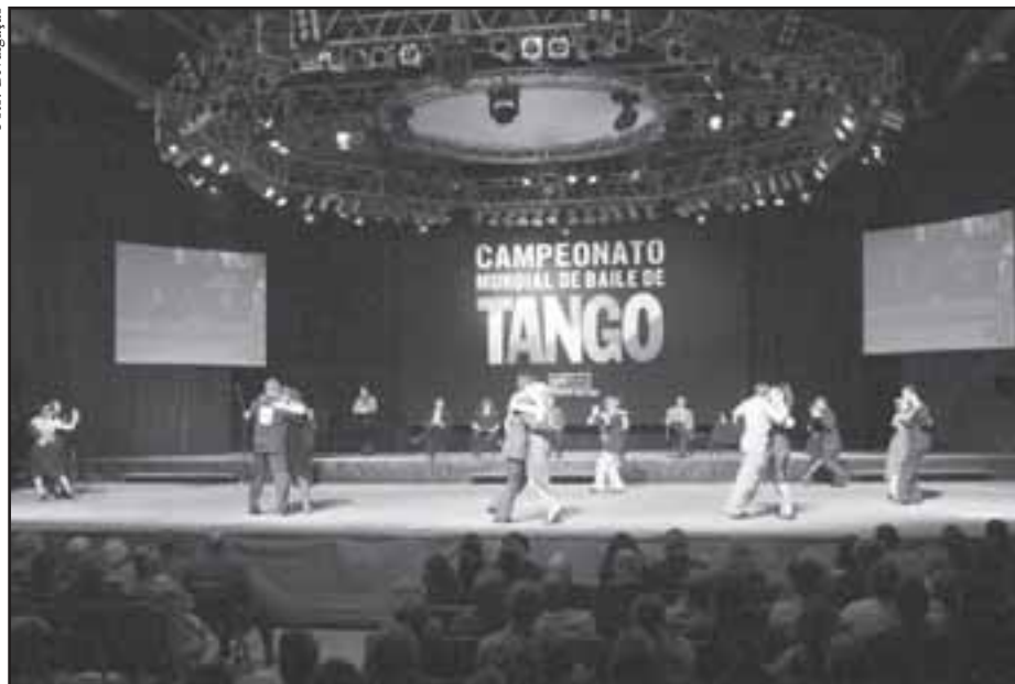
O amplo palco de um grandioso espetáculo

dades do mundo se interessem pela dança do tango”.