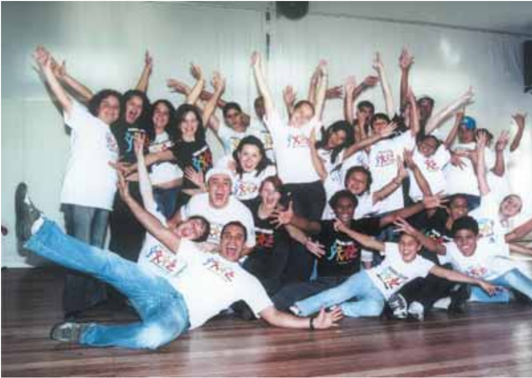
Sempre com alegria, o Projeto Dançando e Educando tem três anos e orgulha o Centro de Dança Jaime Arôxa-Paraná