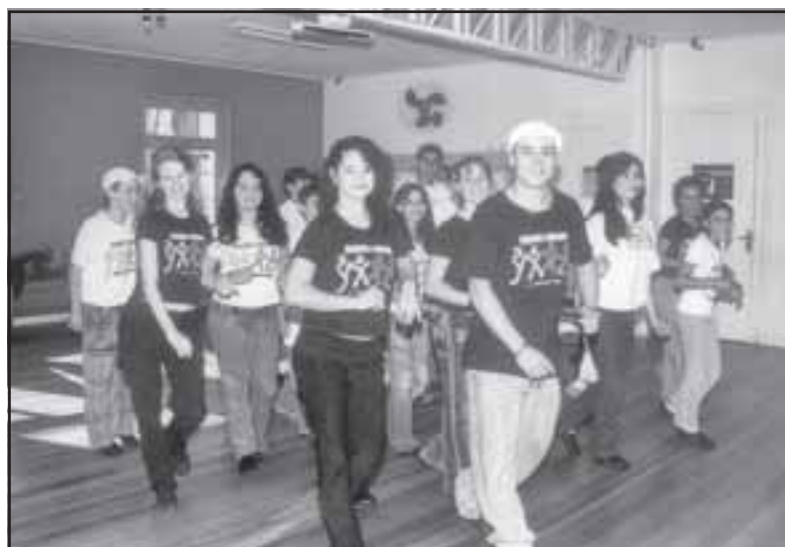
Jovens aprendem todos os ritmos