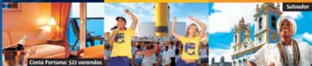
Costa Fortuna: 522 varandas