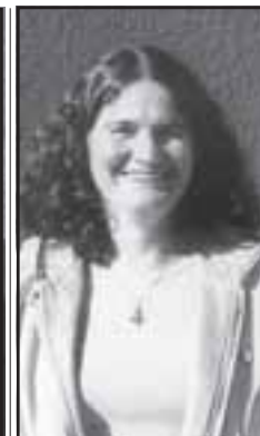
Marli achou solução