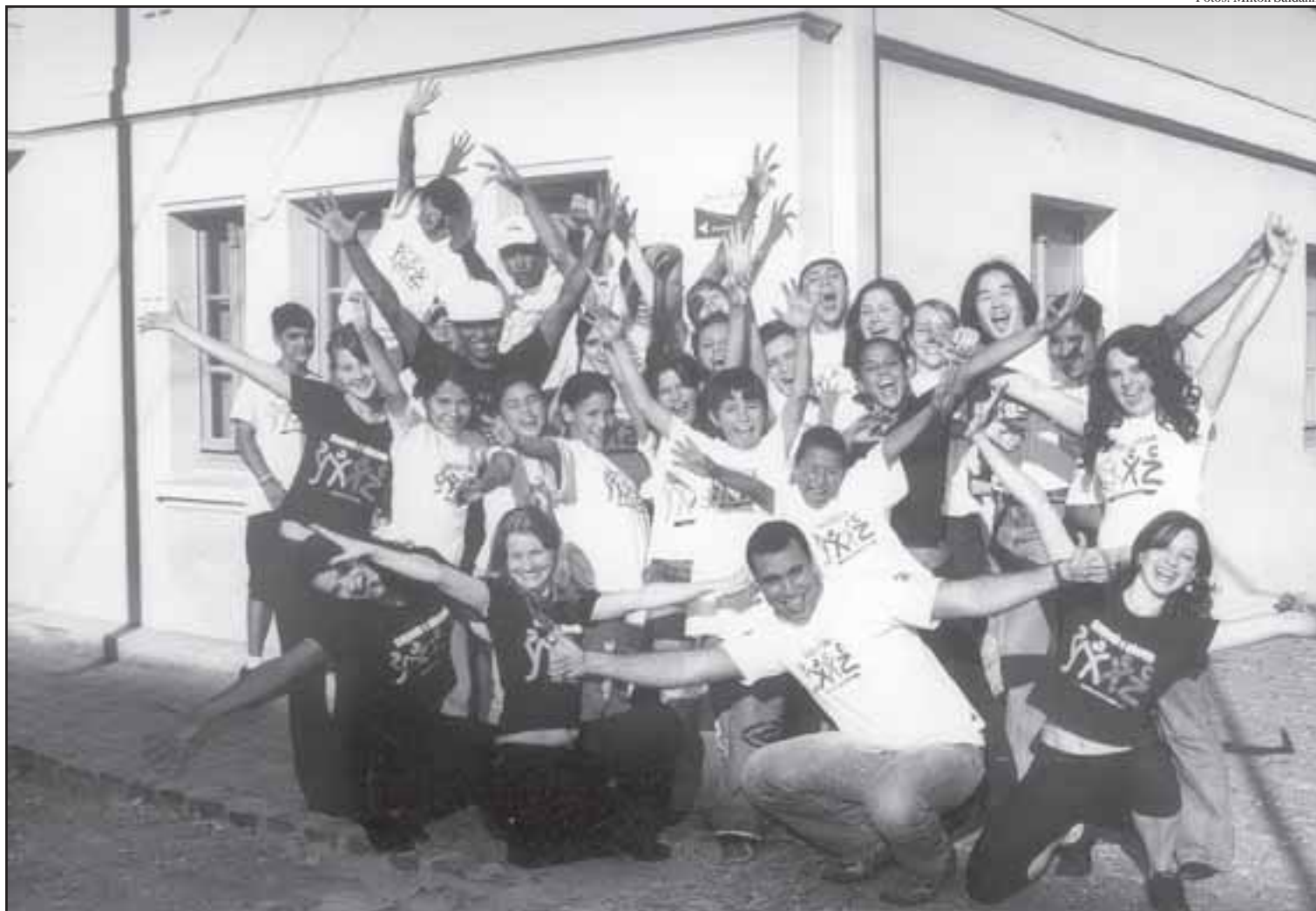
Alegria, descontração e união no grupo

E nquanto a dança não chega nas escolas como disciplina regular e opcional, uma proposta que precisa virar bandeira em todo o Brasil, o Centro de Dança Jaime Aroxa-Paraná (CDJA-PR) decidiu levar as escolas para dentro da dança. Explicando: para sua sede, através do Projeto Dançando e Educando, de grande alcance social, pois privilegia crianças e adolescentes de famílias de baixa renda, que moram na periferia de Curitiba. Elas são indicadas por diferentes escolas da rede pública, por critérios de mérito, como boas notas, por exemplo. Mas, principalmente, pelo desejo de aprender a dançar.