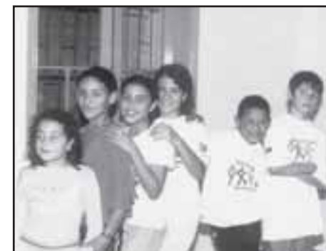
Pequenos já gostam da dança de salão