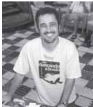
DJ La Luna