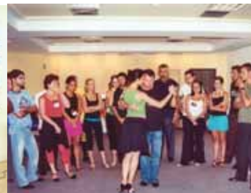
Aulas com ênfase em refinada técnica