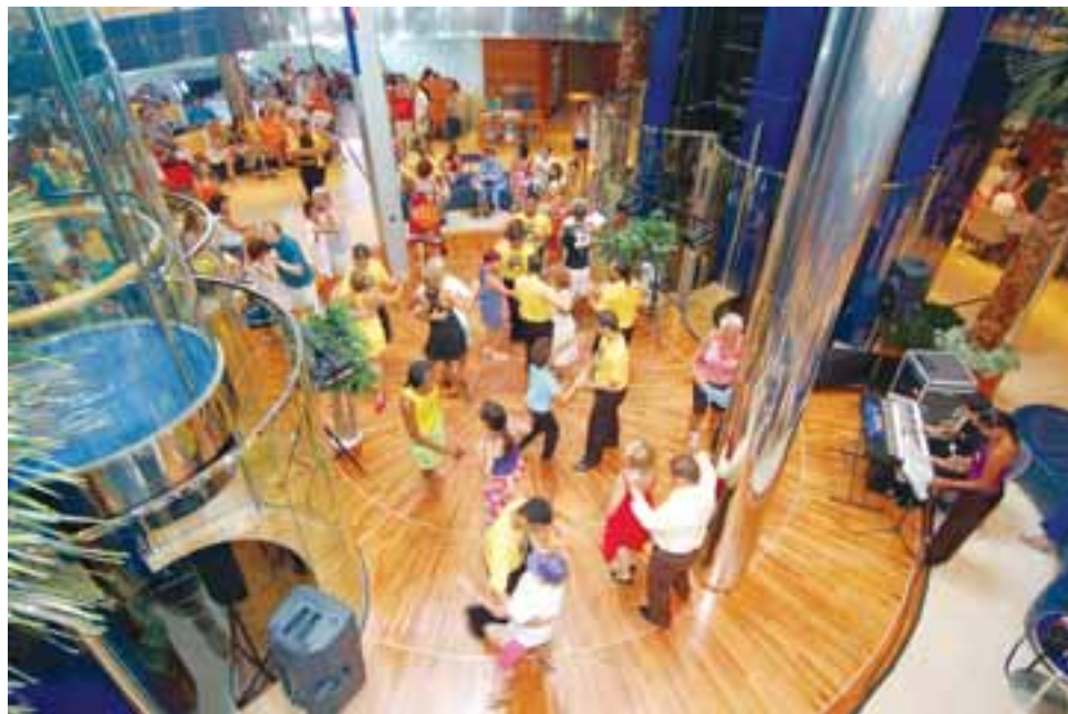
Até o hall central virou pista de dança