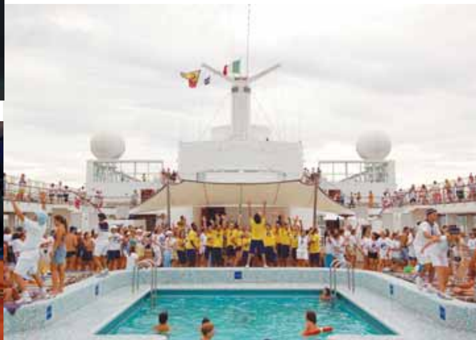
Equipe do Dancing Team na abertura do Dançando a Bordo, no Rio