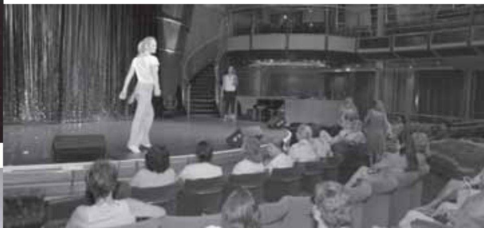
Modelos da grife "Bailarina" mostram as mais recentes criações da marca