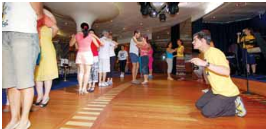
Omar Forte foi uma das estrelas do tango, nas aulas e milongas