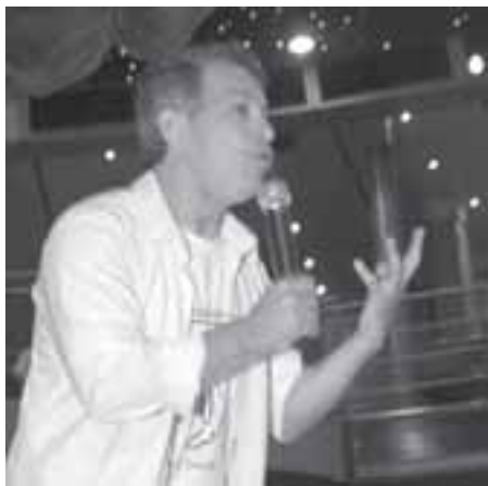
emocionou o público.