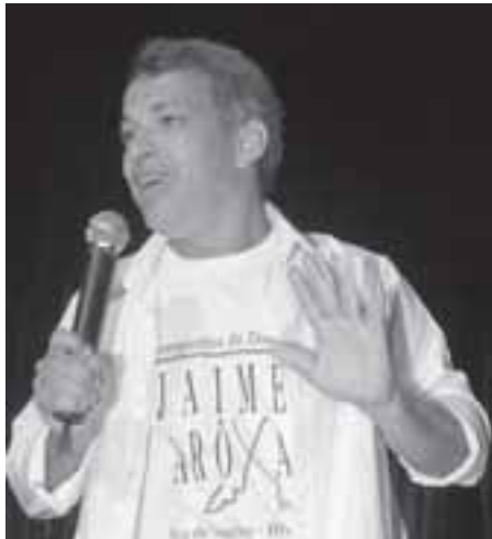
que encantou e...