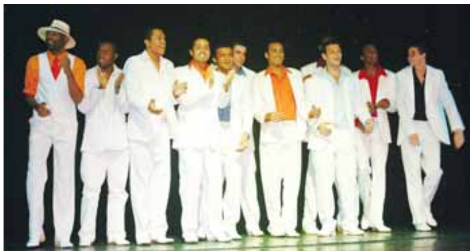
Dançando a Bordo - O Show! conquistou intensos aplausos no Teatro Festival