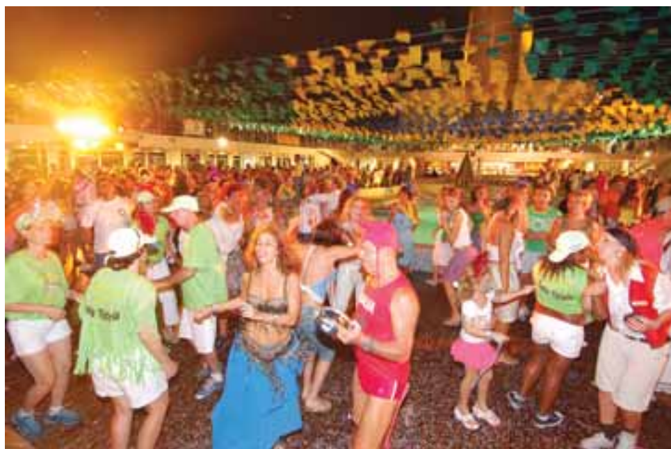
Baile de Carnaval na Arena Jornal Dance