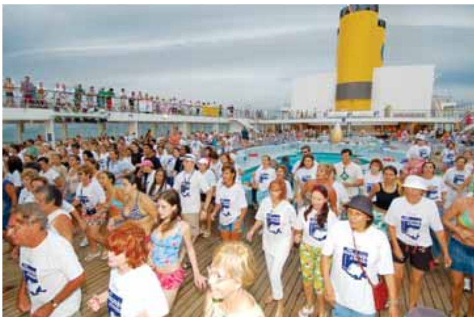
Tempo bom durante toda viagem ensinou muitas atividades a céu aberto