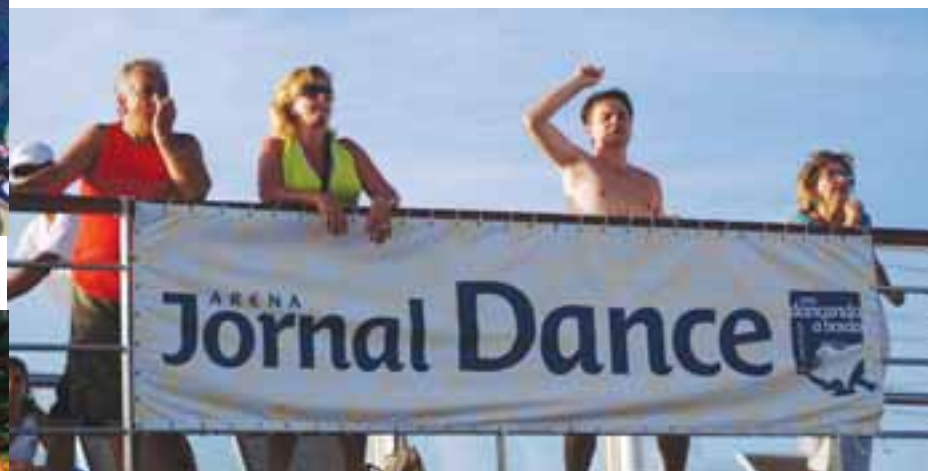
Como em todos os cruzeiros, a Arena Jornal Dance ocupou a piscina central