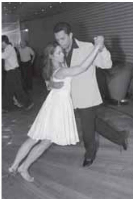
da boate Rock Star, transformada em milonga