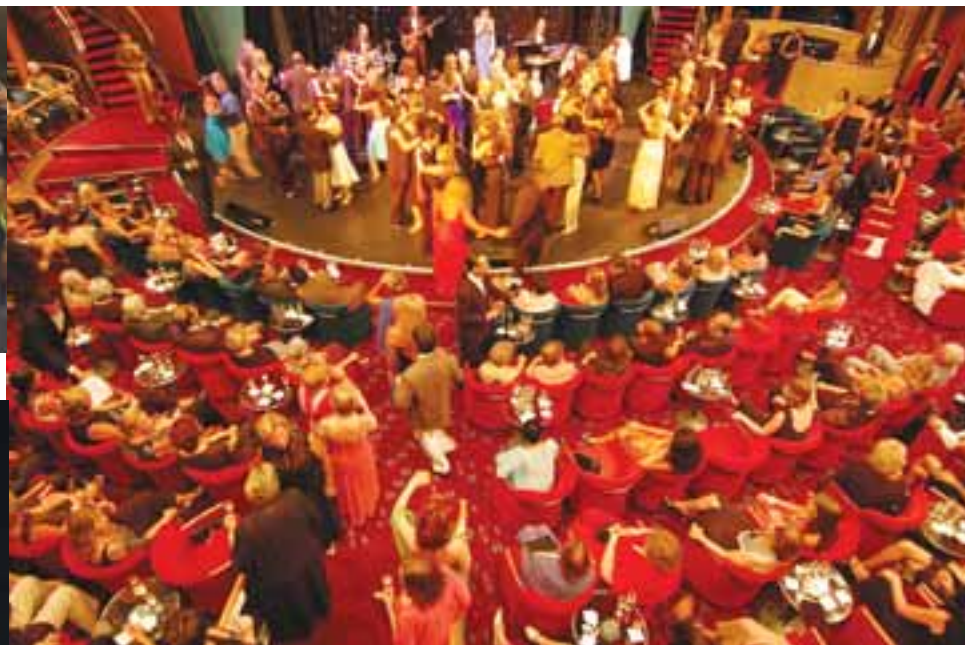
Coquetel de gala com baile no palco do Teatro Festival