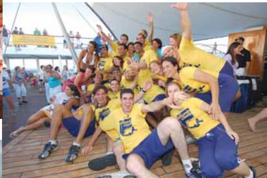
Equipe do Dançando a Bordo na aula de encerramento do cruzeiro