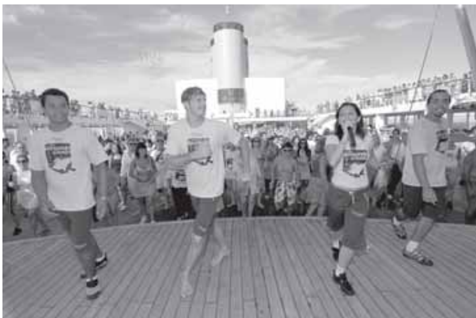
As aulas foram de todos os ritmos, variando do forró ao tango