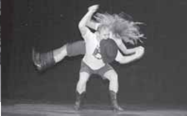
A cobertura fotográfica do Dançando a Bordo é de Camila Turriani, do Studio RUDA.