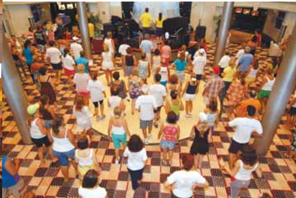
As aulas, no total, foram mais de 80, nos salões e ao ar livre