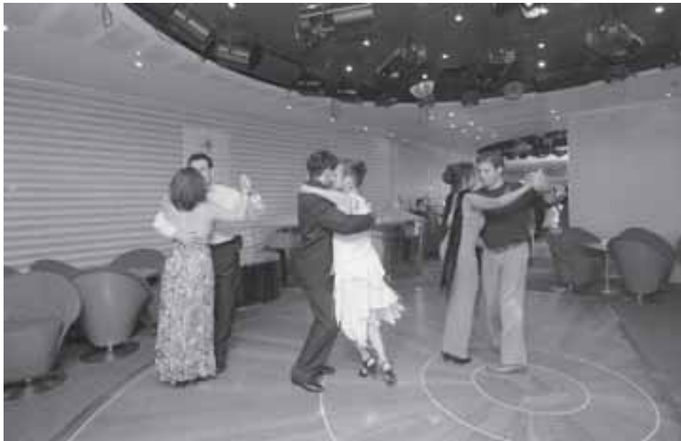
A Estação Tango, da Mostra Paralela de Tango...