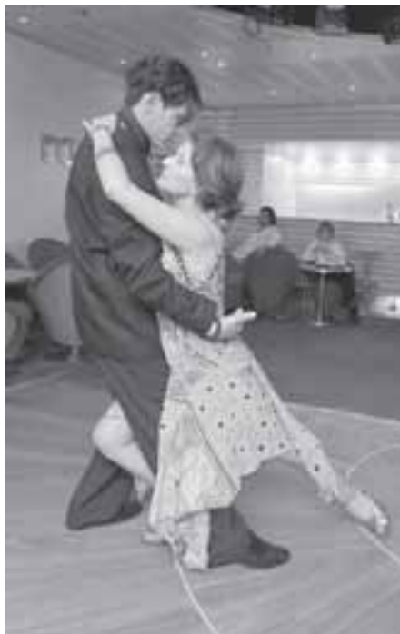
levou casais todas as noites à pista...