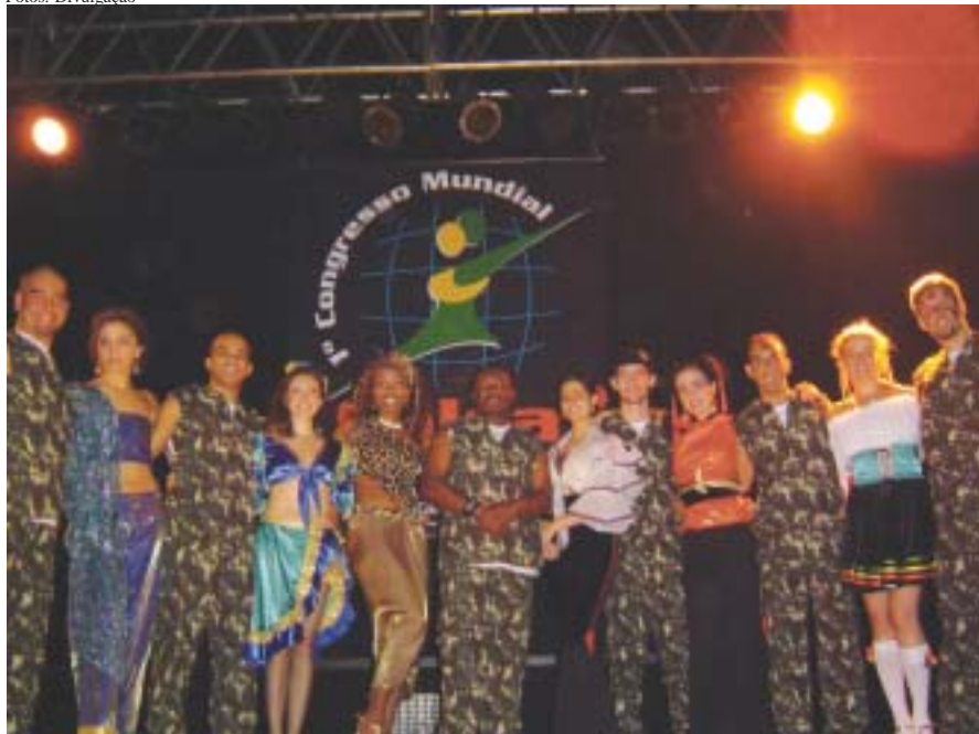
Equipe da Conexión Caribe Cia de Dança, promotora do Congresso, com um dos figurinos que usou no evento anterior