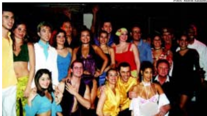
O grupo de finalistas da Capital e...