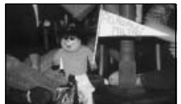
Bonequinho de torcida organizada fez sucesso