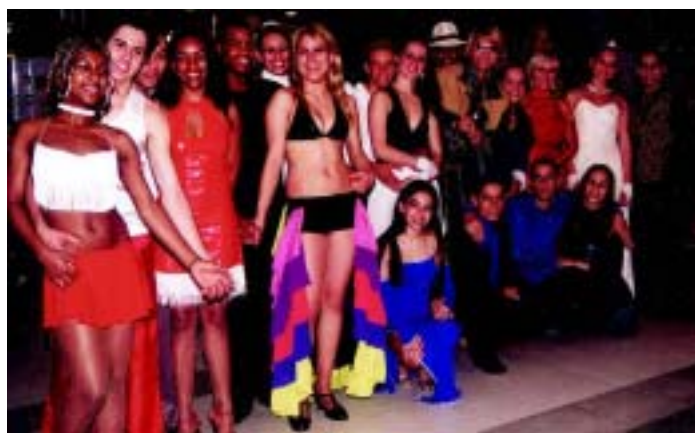
...o grupo dos finalistas do ABC