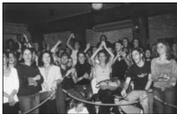
Torcidas organizadas tornaram o evento muito alegre